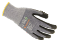
DRY-FIT® AIRFLOW/LIGHT GRIP 100213