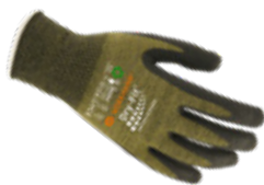
DRY-FIT® AIRFLOW/COLD WOOL 300252