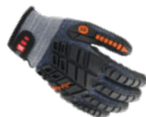
DRY-FIT® AIRFLOW/MPACT 200220