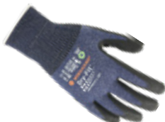
DRY-FIT® AIRFLOW/CUT C GRIP 100218