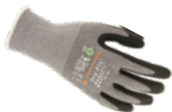
DRY-FIT® AIRFLOW 100209

Glöm allt du vet om monteringshandskar. Workhand® Dry-Fit® är utöver att vara miljövänliga, de smidigaste och mest bekväma handskar du någonsin har upplevt!