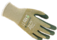
DRY-FIT® AIRFLOW/BIO 100219