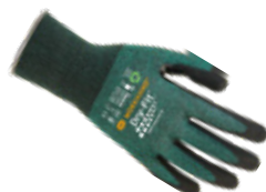
DRY-FIT® AIRFLOW/CUT B 100216