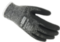
DRY-FIT® AIRFLOW/COLD WOOL WP 300210