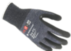
DRY-FIT® AIRFLOW/CUT C 100217