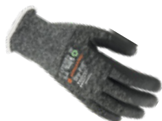
DRY-FIT® AIRFLOW/COLD 300209