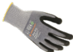
DRY-FIT® AIRFLOW/LIGHT 100212