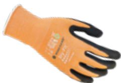
DRY-FIT® AIRFLOW/GRIP 100203