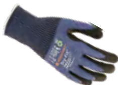
DRY-FIT® AIRFLOW/CUT C 100217