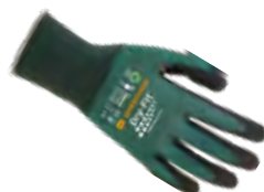
DRY-FIT® AIRFLOW/CUT B 100216