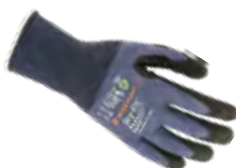
DRY-FIT® AIRFLOW/CUT C GRIP 100218