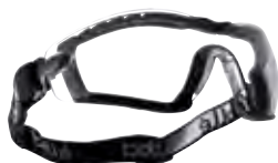
MOD. 900151 COBRA FOAM HYBRID