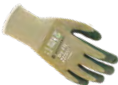
DRY-FIT® AIRFLOW/BIO 100219