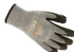
DRY-FIT® AIRFLOW/COLD 300209