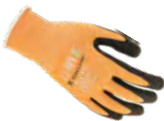
DRY-FIT® AIRFLOW/GRIP 100203