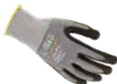
DRY-FIT® AIRFLOW/LIGHT 100212