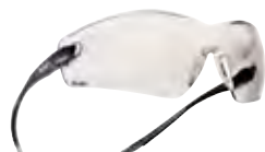
MOD. 900149 COBRA HD