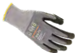
DRY-FIT® AIRFLOW/LIGHT GRIP 100213