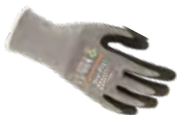
DRY-FIT® AIRFLOW 100209

Glem alt du vet om monteringshansker, Workhand® Dry-Fit® serien er de smidigste og mest komfortable hanskene du noensinne har opplevd!